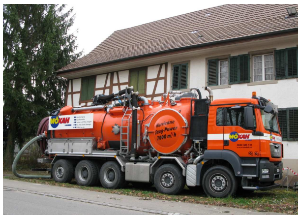
30 m Saugschlauch bis ins Dachgeschoss

Als erstes Hochleistungs-Saugfahrzeug dieser Art in der Schweiz verfügt der erste Fünfachser „Hurricane“ der MÖKAH Flotte neben der Trockensaugereinrichtung über eine zusätzliche Nass-Abscheidkammer für nasse und trockene Medien. Die beiden Abscheideverfahren können wahlweise zugeschaltet werden. Horizontal und vertikal kann über lange Distanzen abgesaugt werden.