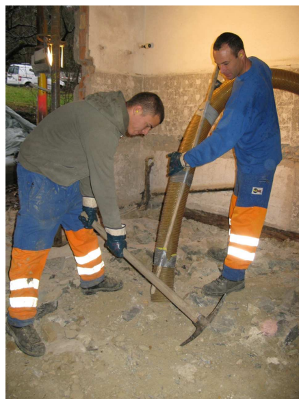
Absaugen von Sand und Bauschutt

Die umweltgerechte Entsorgung und Aufbereitung der abgesaugten Materialien ist jederzeit garantiert.